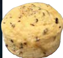
カカオニブメロンパン